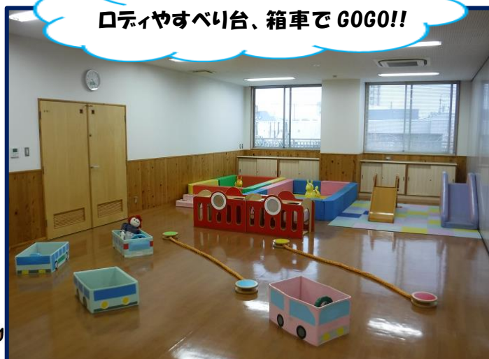
黄コーナー（歩いている子のコーナー）