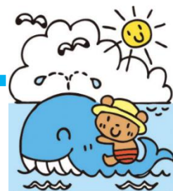
桃コーナー（つたい歩きまでの赤ちゃんコーナー）