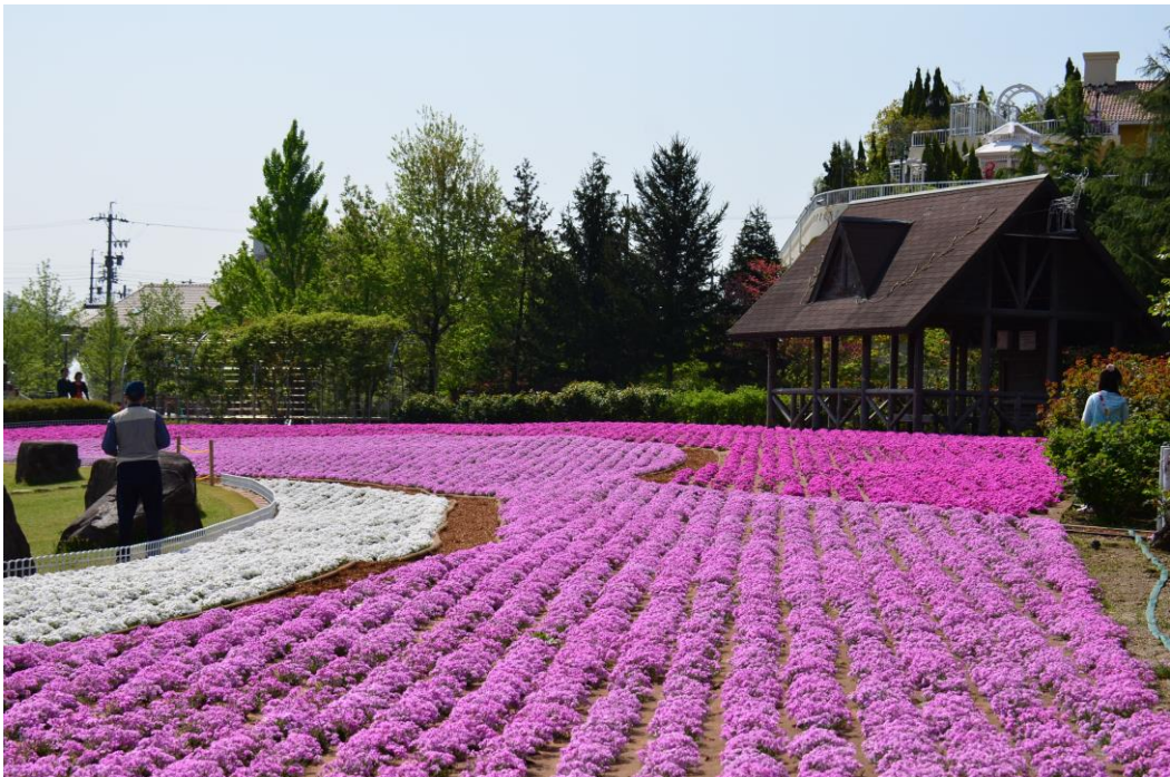
ミササガパーク（猿渡公園）