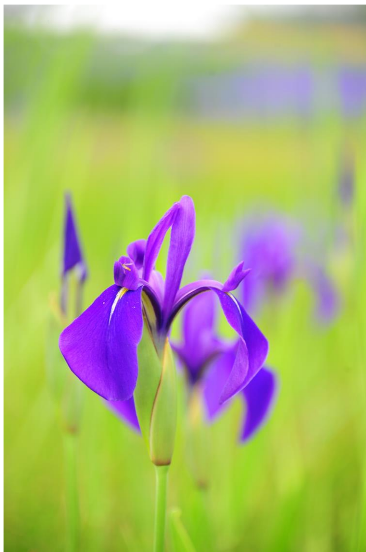
カキツバタ（小堤西池）