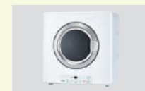
ガス衣類乾燥機 乾太くん

JR野田新町駅徒歩約2分。 通勤も暮らしも時間に余裕が生まれる刈谷の駅近分譲地。