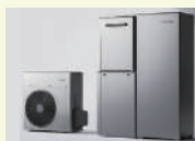
ハイブリッド給湯器「ECO ONE X5」