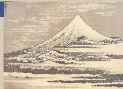
『富嶽百景』初編「快晴の不二」 (浦上コレクション)