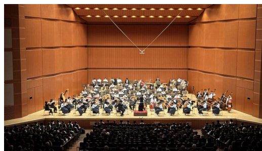
東京フィルハーモニー交響楽団コンサート (令和7年度 大ホール事業)