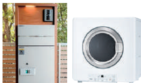
宅配ボックス ガス衣類乾燥機 乾太くん