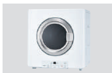
ガス衣類乾燥機 乾太くん