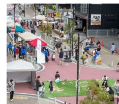
カリマチストリートの活用