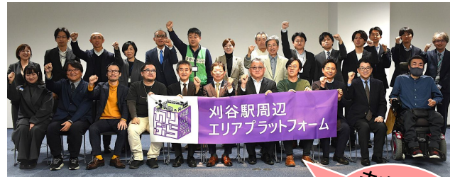
刈谷駅周辺 エリアプラットフォーム

刈谷駅周辺におけるまちの回遊性向上やにぎわい創出等の目指すべき将来像を描き、実現に向けたロードマップや取組を定め共有することを目的としています。