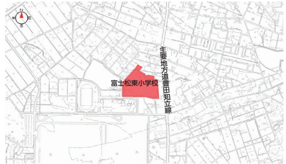
東境町(池田・登り坂・堀池・間野四郎・山畑の一部)