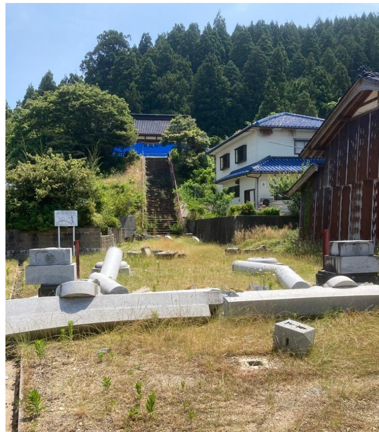
輪島市内被災状況