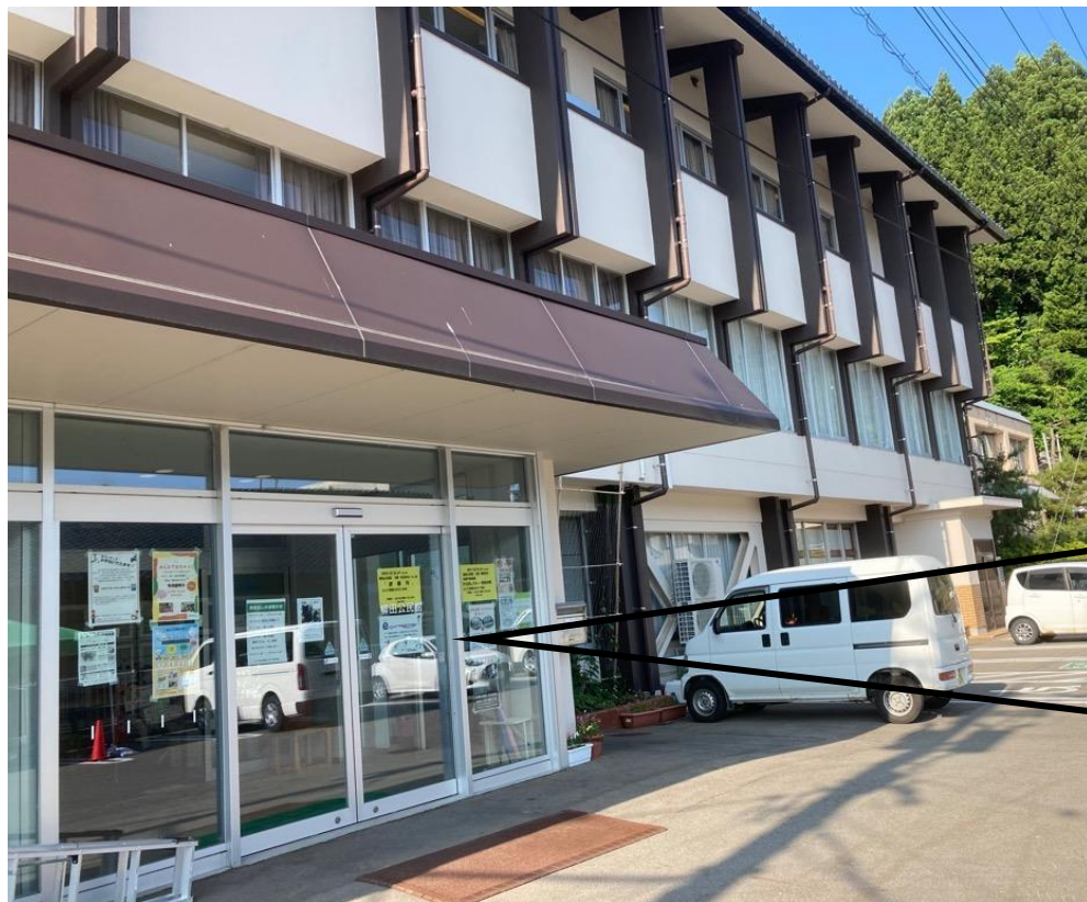
能登町柳田公民館（能登本部）