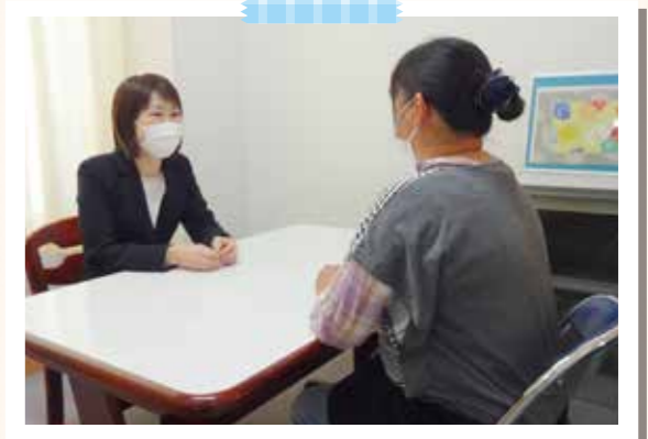
指導員と相談する保護者

とにかく子どもが明るくなり、笑顔が多くなりました。今 では自分から進んで起きてくるようになりました。(D 男の母親)