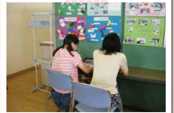
指導員の先生も勉強を教えてくれる

すこやか教室だと落ち着いて勉強できるし、指導員 の先生も勉強を教えてくれるので、すこやか教室に 来てよかった。(B男)