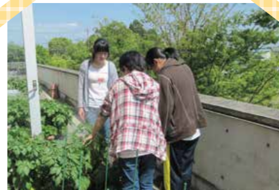
指導員と野菜を育てる子どもたち

すこやか教室では、3教室ともに『親の会』を毎月1 回開催しています。 『親の会』では、困っていることや悩んでいることなど について個別に相談にのったり、参加者同士で意見交換 をしたりしています。どなたでも参加することができます。