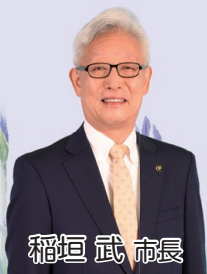
稲垣 武 市長

7月8日に市体育館で開催された、トヨタ車体ブレイヴキングスの日本ハンドボールリーグ2023-24シーズン開幕戦に招待いただき、始球式を務めました。ブレイヴキングスは日本代表選手が多く在籍するなどリーグトップクラスの強豪で、この日も見事勝利。6月の全日本社会人選手権大会優勝の勢いに乗り、今年5年ぶりのリーグ優勝を果たして欲しいです。