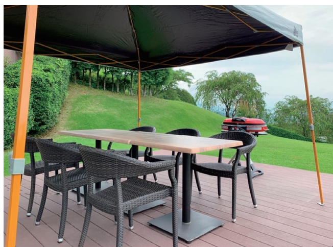
▲コンロやタープテントは、事前に設置済み。 準備いらずで楽しめます。