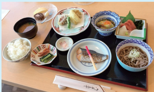
▲割子弁当 1,100円（3日前までに予約） 通常のランチ営業も行っています。