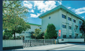
住吉小学校(徒歩24分)