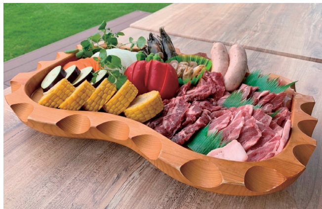
▲2人分（おにぎりが付きます）