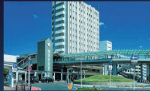
JR・名鉄刈谷駅(徒歩16～17分)

「刈谷」駅へは徒歩16分～17分。駅周辺の商業施設はもちろん、子どもが喜ぶ「交通児童遊園」や都心生活ならではの「刈谷市中央図書館」「刈谷市美術館」などの文化施設も楽しめます。通学区は「住吉小学校」です。