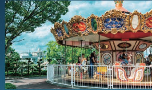
刈谷市交通児童遊園(徒歩12分)