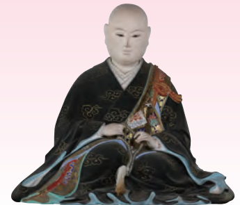
清浄院座像(熊本・法宣寺蔵)