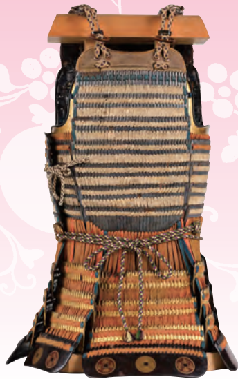
家康産衣の鎧(入海神社蔵・熱田神宮宝物館寄託)