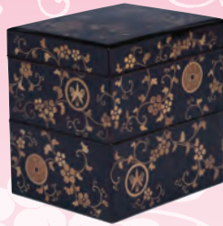
[阿久比町指定] 重箱(洞雲院蔵)