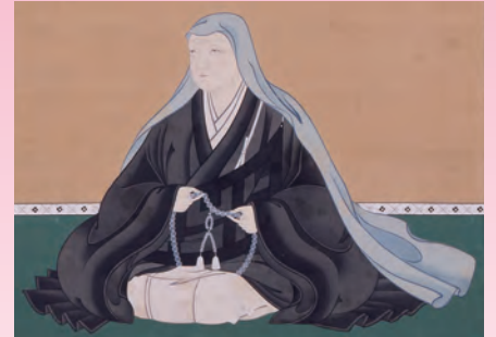
芳春院妙西尼像(部分)(専福寺蔵・岡崎美術博物館寄託)