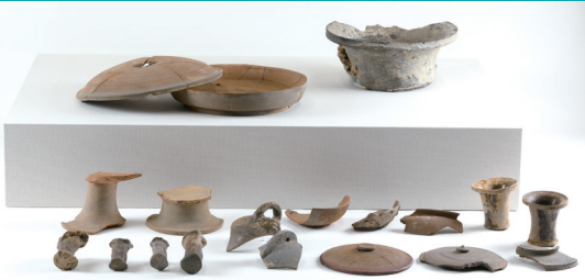
洲原第8号窯 (IG-18) 当館蔵