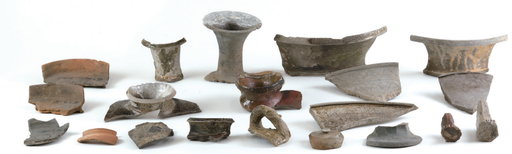
孫六第1号窯 (IG-8) 当館蔵

本展では、愛知県陶磁美術館所蔵資料や 近年調査・整理した新出資料を展示し、刈谷 のものづくりの歴史の一端を紹介します。