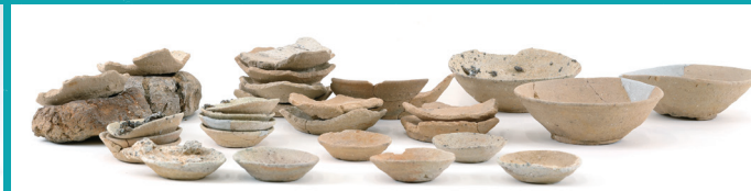
石神第3号窯 (IG-G-11) 当館蔵