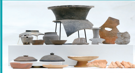
西石根第7号窯 (IG-67) 愛知県陶磁美術館蔵