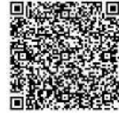
▲甲冑レプリカ試着体験

対 2歳以上 定 各10人 ID 1011581 時 ◆ダンボールかぶと作り 4月30日(日) 10時、13時 30分(各60分) 内 親子で協力してダンボールかぶとを作ります。