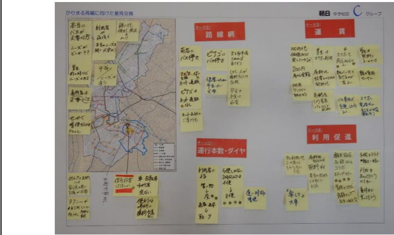
(★シール：他グループの参加者が「これ良いアイデア!」「共感!」「新たに気づいたこと!」と感じた意見)