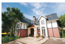
スバカマナ刈谷店 (築地町) ▶