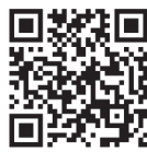
▲業界研究会・合同企業説明会

時 2月14日(火)・15日(水) 9時30分、14時(各3時間) 場 産業振興センター 内 西三河地区の企業約20社が参加する業界研究会・合同企業説明会を開催します。参加企業の詳細はQRコード参照。