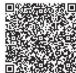
▲あいち電子申請・届出システム

送、FAX(63・6108)または直接、歴史博物館(〒448・0838 逢妻町4・25・1・(休)日曜)へ。 ※あいち電子申請・届出システム(QRコード参照)からも申込可