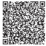
▲あいち電子申請・届出システム