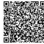
▲あいち電子申請・届出システム

FAX(63・6108)または直接、歴史博物館(〒448・0838 逢妻町4・25・1・休月曜)へ。 ※あいち電子申請・届出システム(QRコード参照)からも申込可