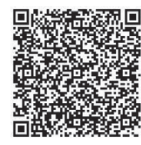
▲あいち電子申請・ 届出システム

12月26日・29日〜1月3日・ 10日)へ。 ※あいち電子申請・届出シス テム(QRコード参照)から も申込可