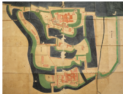
▲某城之図(本光寺常盤歴史資料館蔵)