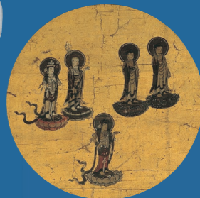
春日鹿曼陀羅 (幸田町本光寺蔵)