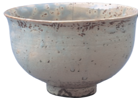
▲熊川茶碗 (幸田町本光寺蔵)