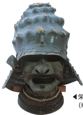
▲宋螺形兜 (幸田町本光寺蔵)