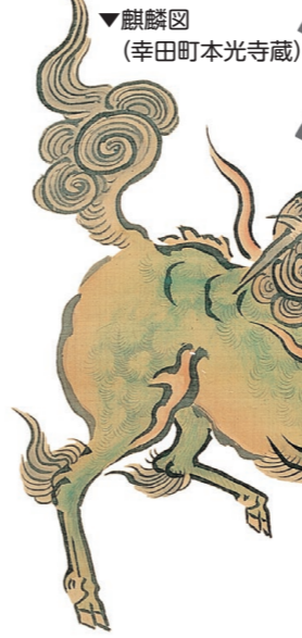
▼麒麟図 (幸田町本光寺蔵)

※期間 10月8日(土)～11月20日(日) 前期：10月8日(土)～30日(日) 後期：11月1日(火)～20日(日)