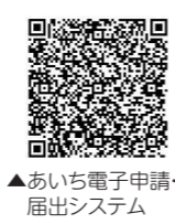
▲あいち電子申請・届出システム

QRコード付きマイナンバーカード交付申請書を持っていない人は、市民課まで連絡、または、あいち電子申請・届出システム (QRコード参照) で郵送の依頼ができます。