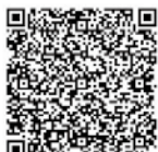
▲あいち電子申請・届出システム