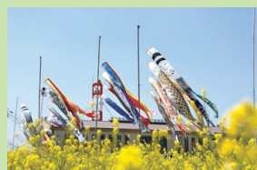
▲フローラルガーデンよさみ