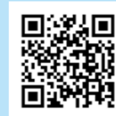
▲カリアンブレラ公式HP