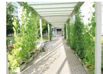
▲令和3年度最優秀賞 (株)デンソーDN 緑のプロジェクト (グリーンカーテン活動)