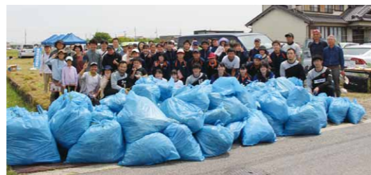
▲たくさん駆除できました (令和3年度)

当日は選手・監督・コーチが参加します。各チームはさまざまな地域貢献活動を実施し、スポーツを通じた魅力あるまちづくりにご協力いただいています。