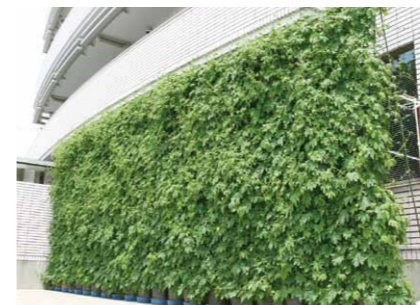
▲令和3年度最優秀賞 角文(株)