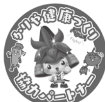
▲オリジナルステッカー

対 市内在住の令和4年4月1日現在20歳以上で、平日午後2時間程度の会議（3カ月に1回程度）に出席できる人