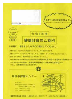
▲受診券の入った封筒