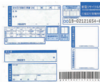
▲家電リサイクル券

※③の方法で処理する場合は、家電リサイクル券と収集運搬手数料領収証明書を透明なビニール袋などに入れた状態で、貼り付けて出してください。