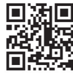
▲家電リサイクル券センターQR

自分で処理する場合は、事前にメーカーやサイズを確認し、市内の郵便局で家電リサイクル券を購入して、下記①～③のいずれかの方法で処理してください。家電リサイクル料金は、品目・メーカー・サイズによって異なります（右記QRコード参照）。