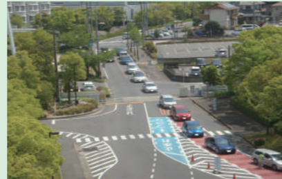
▲クリーンセンターは2～3時間待ちの日も

例年3月や4月は処理施設が大変混み合います。また、戸別有料収集も1日当たりの受付数に限りがあるため、希望回収日に回収できない場合があります。粗大ごみは計画的に処理してください。