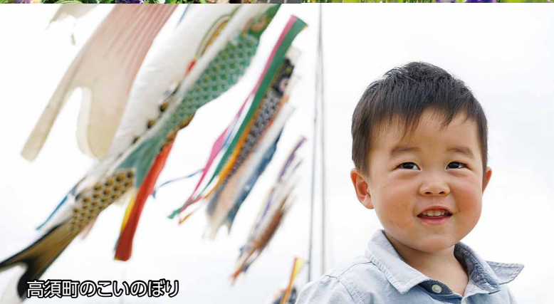
高須町のこいのぼり