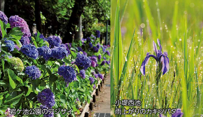
岩ヶ池公園のアジサイ