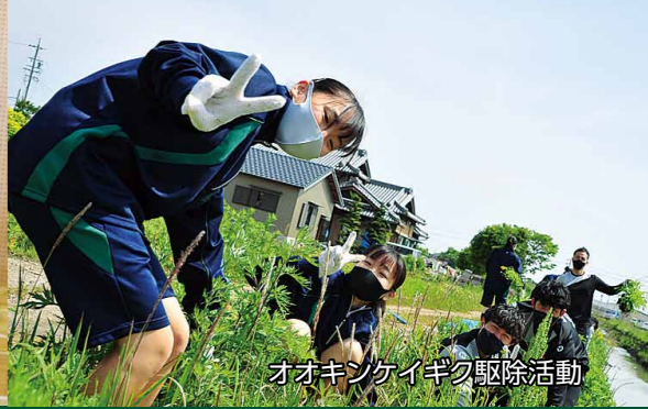
オオキンケイギク駆除活動