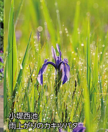
小堤西池 雨上がりのカキツバタ