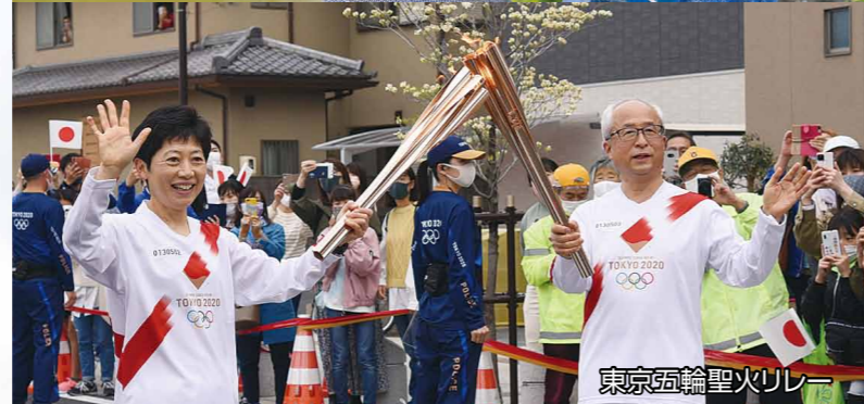
東京五輪聖火リレー