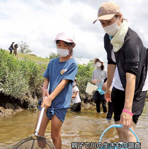
親子で川の生きもの調査