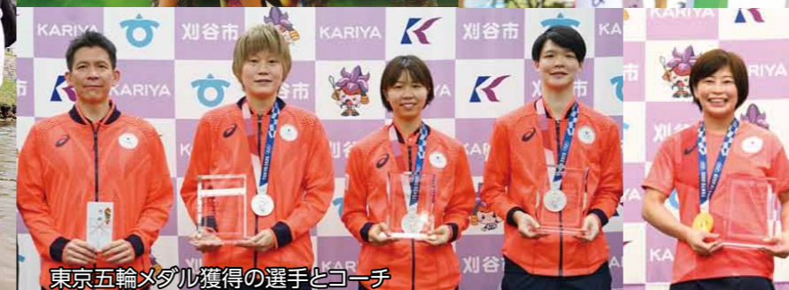
東京五輪メダル獲得の選手とコーチ