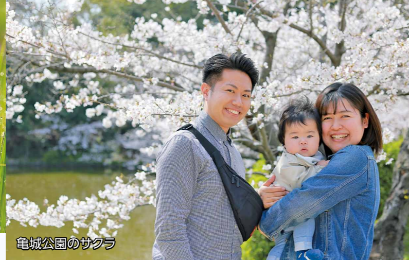
亀城公園のサクラ