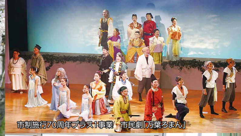
市制施行70周年プラス1事業「市民劇『万葉るまん』」