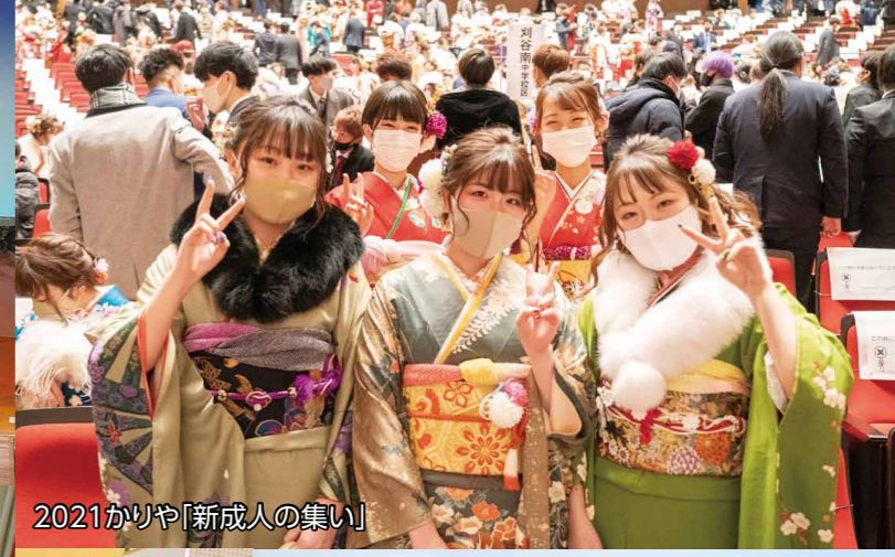
2021かりや「新成人の集い」