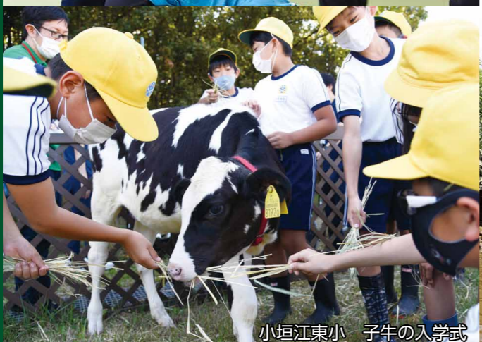
小垣江東小 子牛の入学式