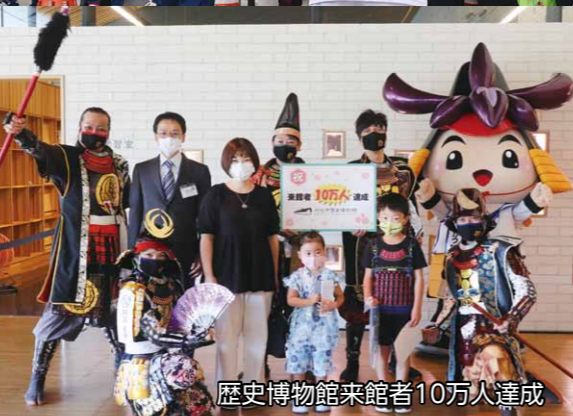
歴史博物館来館者10万人達成