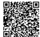
▲コロナワクチンナビ

※1・2回目接種については予約枠を縮小しており、予約が取りにくい場合があります。