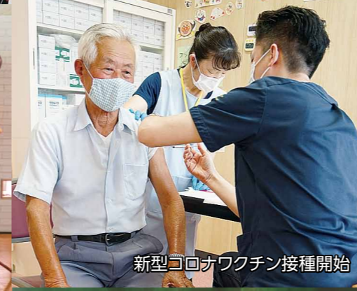
新型コロナワクチン接種開始