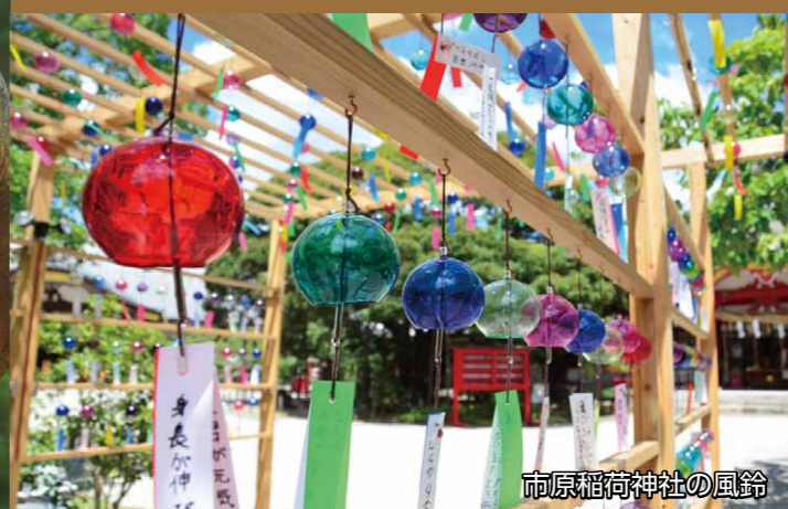
市原稲荷神社の風鈴