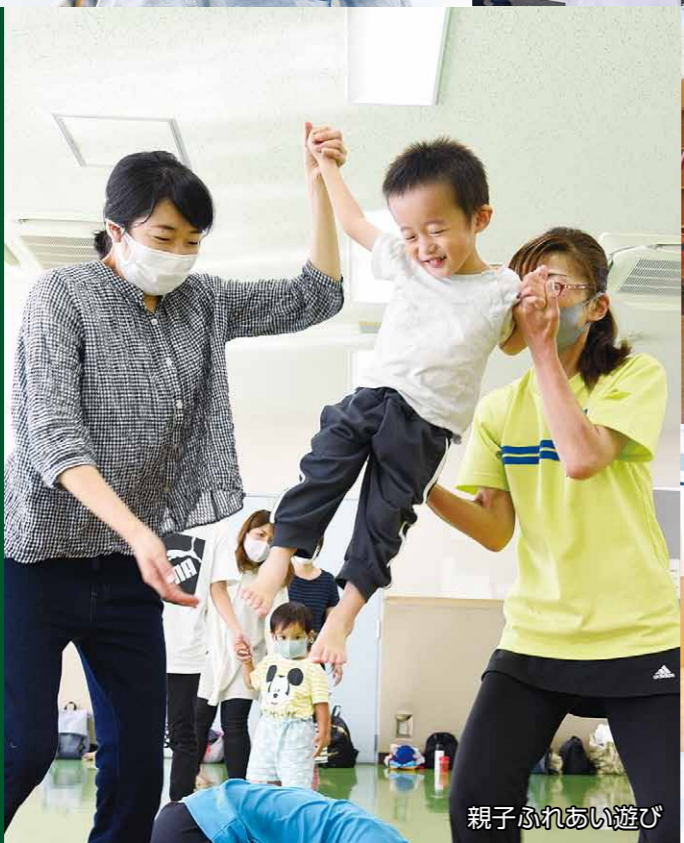
親子ふれあい遊び