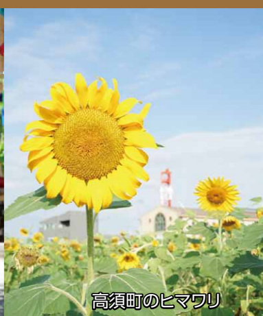
高須町のヒマワリ