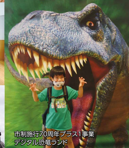
市制施行70周年プラス1事業 デジタル恐竜ランド