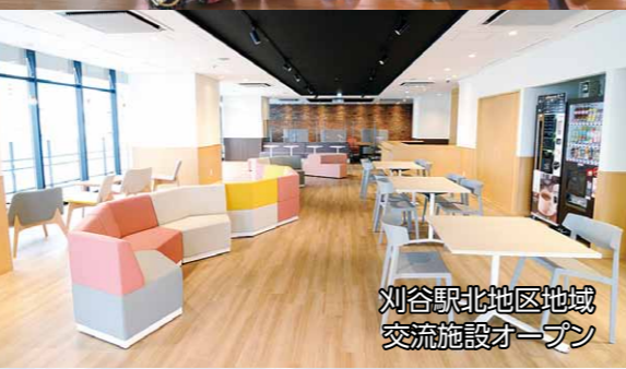
刈谷駅北地区地域 交流施設オープン