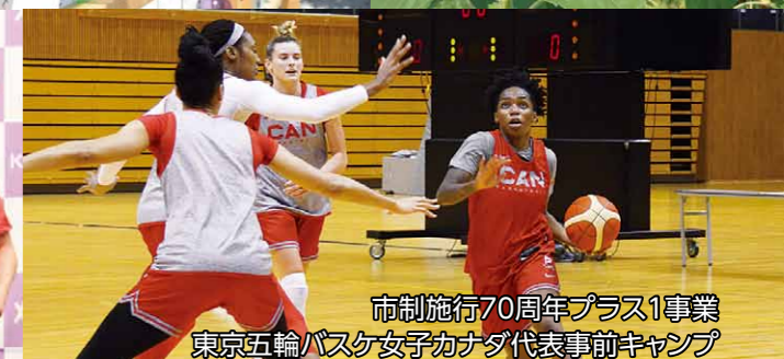
市制施行70周年プラス1事業 東京五輪バスケット女子カナダ代表事前キャンプ

刈谷の1年を 振り返って いろいろなことが制限される中、市では東京五輪聖火リレーという大きなイベントをはじめとしたたくさんの出来事がありました。ここではその出来事を写真で紹介して1年を振り返ります。