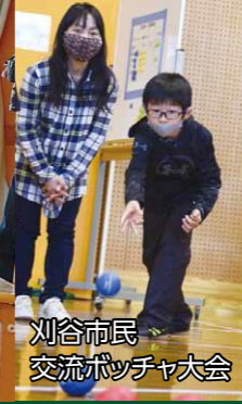
刈谷市民 交流ポッチャ大会