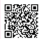
▲d garden 東刈谷店