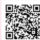
▲ソフトバンク 刈谷