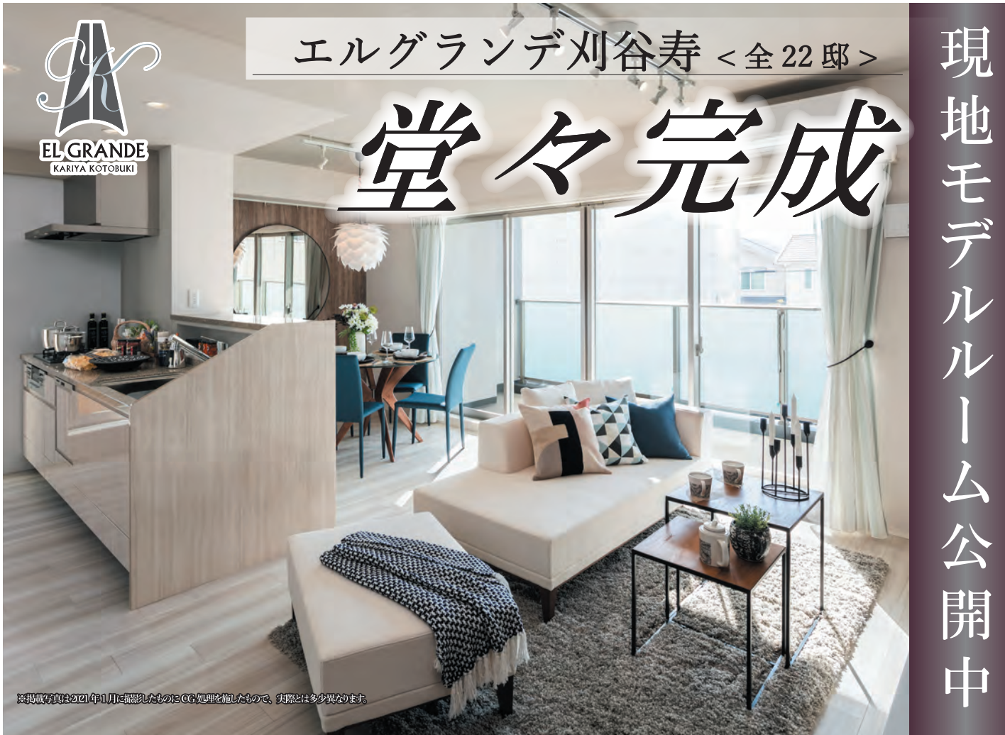
※掲載写真は2021年1月に撮影したものにCG処理を施したもので、実際とは多少異なります。

B-1 TYPE 3LDK +ウォークインクローゼット +シューズインクローゼット 4LDK・Bタイプもご用意