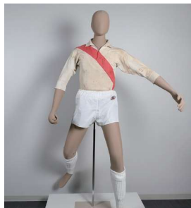
刈谷高校サッカー部ユニフォーム (昭和30年代) (個人蔵)

刈谷高校サッカー部が昭和29・30年に国体を連覇し、刈谷市は「サッカーのまち」と言われるようになりました。市内では他にも、企業が行う社会人スポーツ(いわゆる「実業団」)が盛んに行われ、全国規模の大会で活躍しています。本展では戦後の刈谷市におけるスポーツの歴史を、チームや選手のみならず、彼らを支える人々(観客、応援団、マネージャー、監督・コーチ)にも注目し、紹介します。