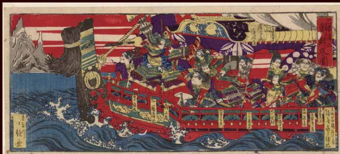
▲玩具絵（加藤清正朝鮮攻の図）