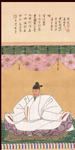
▲豊臣秀吉画像（部分） （山田秋衛模写） [名古屋博物館蔵]