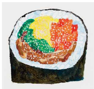
《味の手帖》(キンパ) 2018年