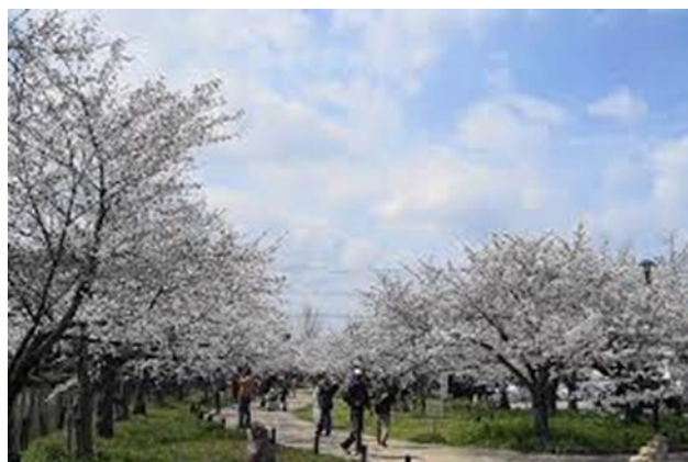
亀城公園【愛知県刈谷市】