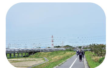
サイクリングロードコース

ウイングアリーナ刈谷をスタートして秋風が心地よい逢妻川堤防の田園風景を川辺の野鳥を楽しみながらサイクリングロードをウォーキングします。