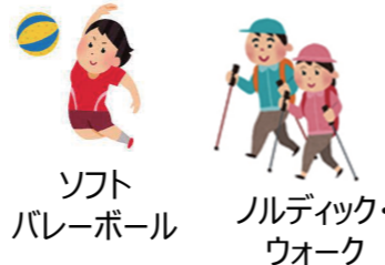
ソフトバレーボール