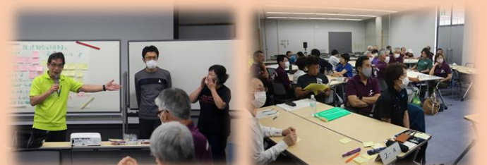
検討内容の発表と質疑応答