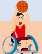
車椅子バスケ 腕の力だけでは リングまでボール が届きません・・・