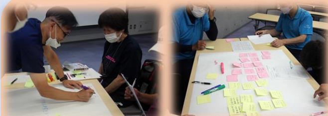
8グループに分かれて検討