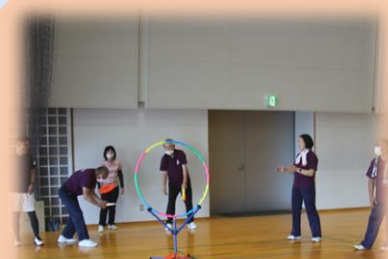
フライングディスク 微妙なコントロールが 難しい！