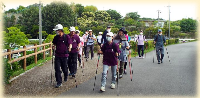
洲原公園 小堤西池 カキツバタコース