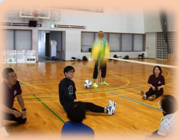
シッティングバレー 前に一歩が出ないので 身動きできず。