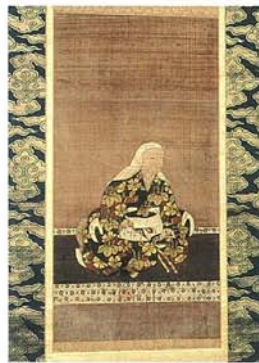
於大の肖像画・絹本着色伝通院画像 この肖像画は愛知県文化財に指定されており、於大の姿を最もよく伝えているといわれています。