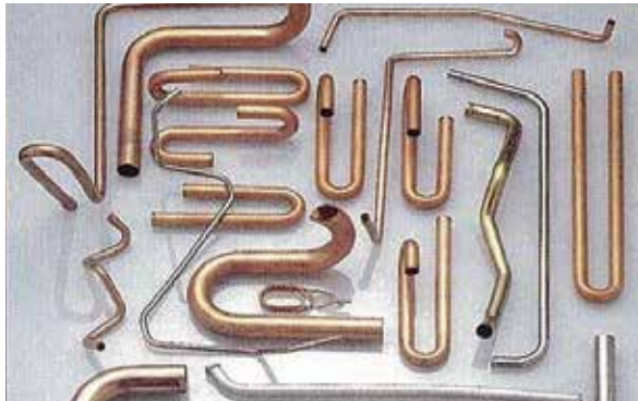
オスガーマシンのパイプベンダーでの加工サンプル