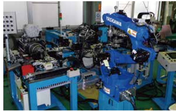
パイプ端末加工～曲げ～後端末加工～検査の自動ライン