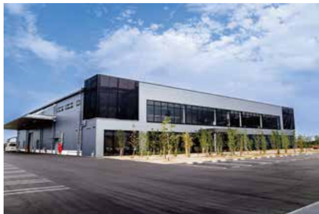
設備部品などを製作し、お届けしています。