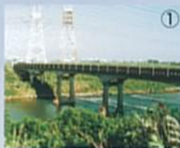
清水橋 四角のまどがかわいらしい

最近では徐々に改修されて数少なくなったコンクリートの橋です。ちょっと変わったデザインですが、長年の存在感のためか、川の風景にとけ込んで見えます。