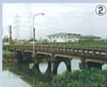
境橋 繊細で上品な感じ