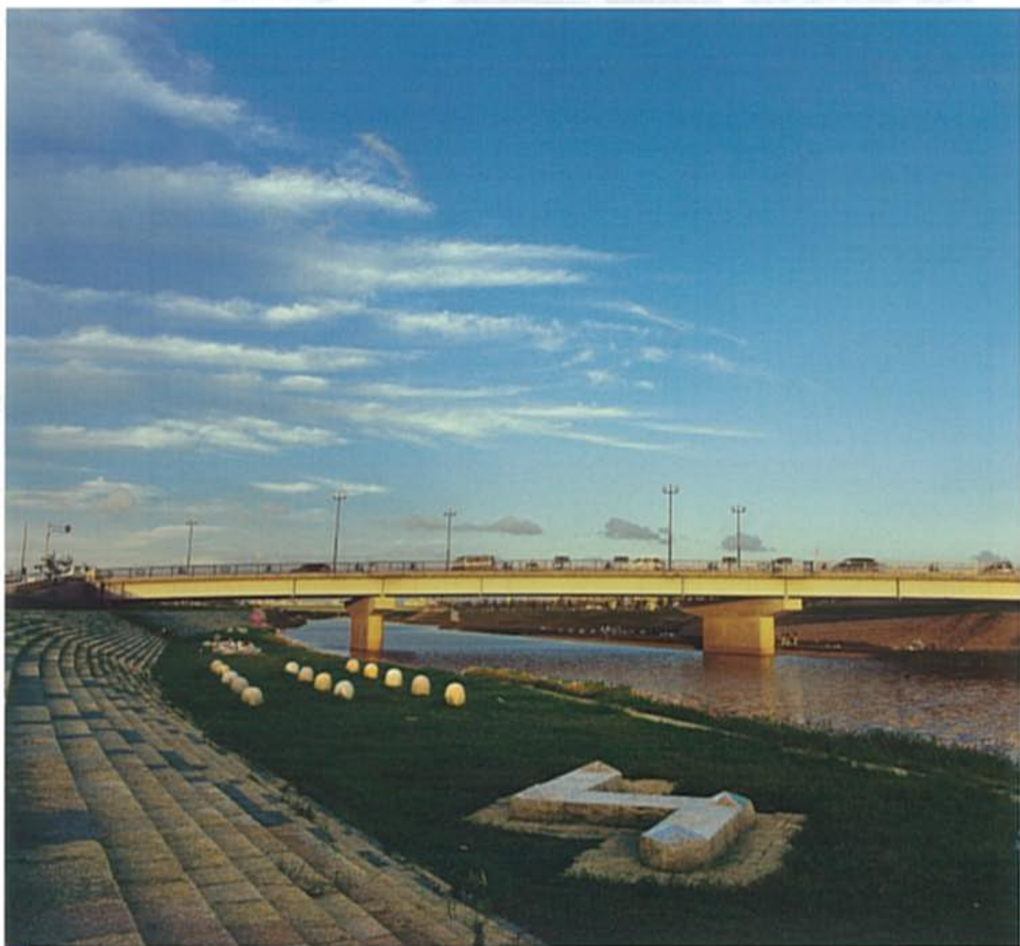
連妻橋と連妻川緑地

ひんやりとした朝をむかえるようになりました。 まちの木々も葉を落として、冬支度をはじめています。 総合運動公園と隣接する連妻川の河川敷には、 渡り鳥の姿が見られるようになり、 冬の景色を彩っています。