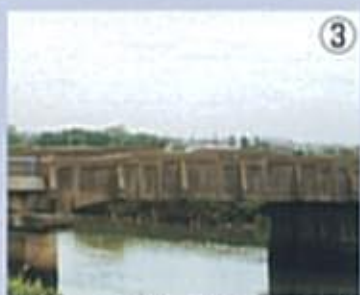
刈谷橋 いかめしくどっしりした感じ