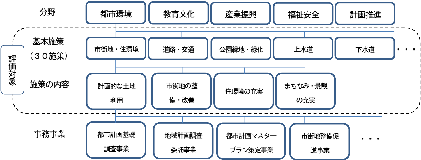
第7次総合計画施策体系イメージ(図-1)