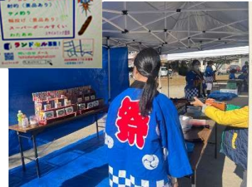
高校生ボランティアが活躍！