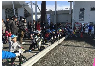
ランバイクでスタートの瞬間

子ども向けのスポーツイベントを行おうと、刈谷市総合運動公園で、2012年から種目別のスポーツイベントを開催し、2016年から名称を「カリフェス(刈谷フェスティバルの略)」へ変更し、開催してきました。子どもたちが日ごろの練習の成果を発揮する場を作り、子どもが主役の冬のイベントとして確立させていきます。「かりや夢ファンド補助金」は、会場費や設営費などに活用しました。