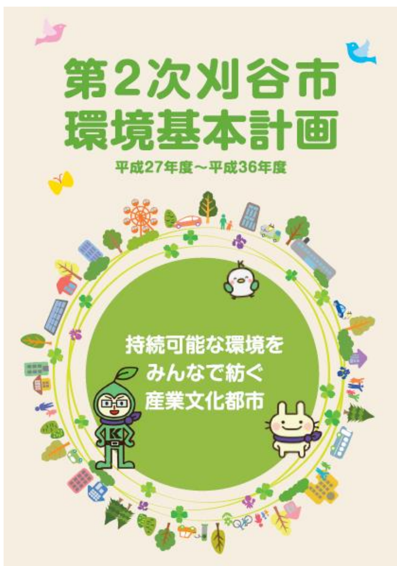
第2次刈谷市環境基本計画