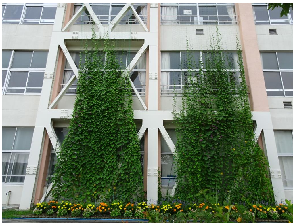
衣浦小学校 グリーンカーテン